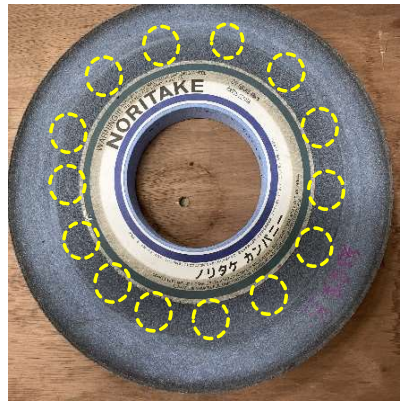
使用済み廃棄予定砥石